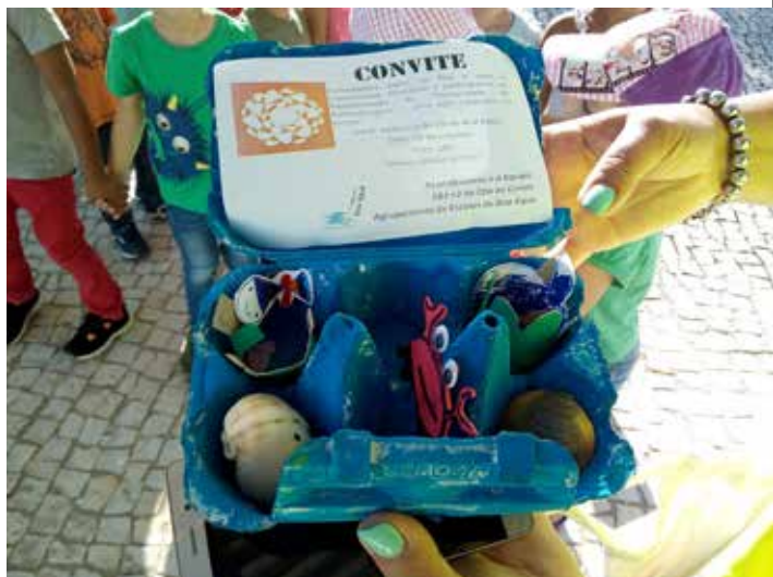
Convite. Sonho do Agrupamento de Escolas de Boa Água, Portugal

momentos pontuais e, assim, explicam o projeto educativo da escola. Noutras escolas, o que funciona normalmente é a transmissão de boca a boca: as famílias do bairro passam a informação em espaços informais, tais como diante da porta de entrada, à saída da escola, no mercado, na vizinhança, etc.