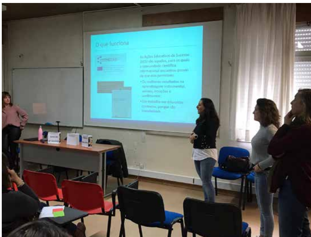
Sensibilização no Agrupamento de Escolas Ferreira de Castro, Portugal

O objetivo principal da sensibilização é colocar à disposição de todas as pessoas interessadas, as Ações Educativas de Sucesso e os conhecimentos científicos em que se baseiam as Comunidades de Aprendizagem, para que, após um processo intenso de reflexão e debate, possam decidir se querem ou não se constituir como Comunidade de Aprendizagem.